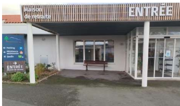
Emplacement pour les résidents/visiteurs