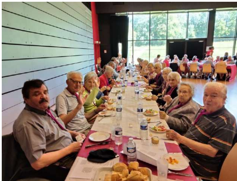
Journée rencontre Alliance Mormaison

Afin de mieux faire connaître ses actions, une lettre d'informations trimestrielle est à l'affichage à destination de tous. Parmi les actions fédératives initiées, un Fond de dotation a été créé en 2024 . Il a pour objectif de collecter des fonds qui pourront ensuite être utilisés pour améliorer le quotidien des résidents de chaque maison. Pour plus d'informations vous pouvez vous renseigner auprès de la direction de l'établissement.