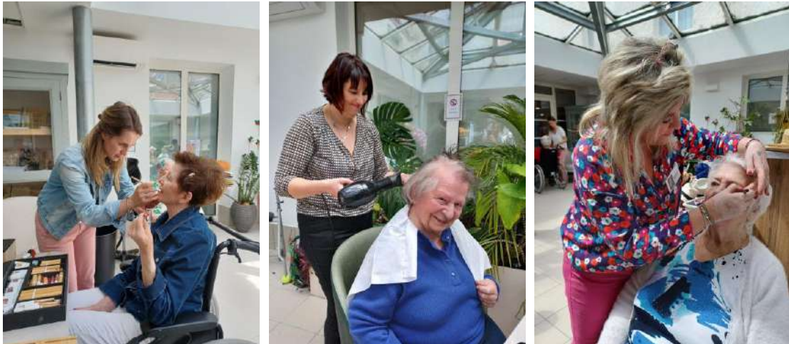
Mise en beauté des participantes

Maquillées et coiffées grâce à l'intervention d'une socio esthéticienne, nos participantes ont eu plaisir à défiler, de se prêter au jeu de ce concours de beauté, soulignant ainsi que la beauté n'a pas d'âge.