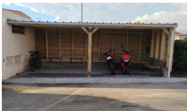
Nouvel abri à vélo

Enfin, grâce à une subvention obtenue auprès de l'ARS, un nouvel abri à vélo a été construit. Il est à destination de tous, salariés et visiteurs. L'ancien emplacement devenu libre, permet aux résidents qui le souhaitent, de sortir aux beaux jours et de profiter d'un endroit ombragé, situé près de l'entrée.